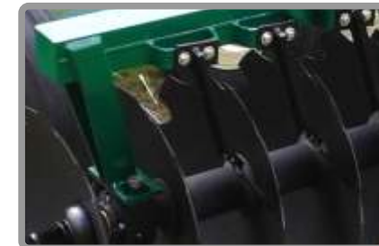
Limpiadiscos tipo pala, reforzados con soportes individuales.