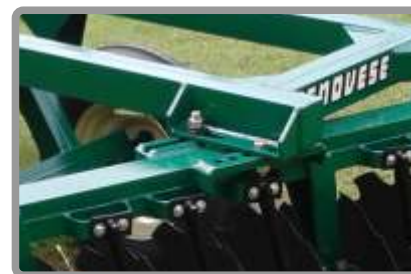
Correderas mixtas que evitan desplazamiento por desajuste.